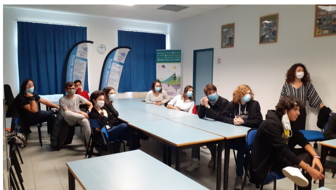
Visioconférence entre les deux équipes du projet, ici à Bastia

Dans un premier temps les élèves se sont rencontrés via la plateforme numérique eTwinning mise à disposition par la communauté pédagogique Européenne. Ensuite et afin de « briser la glace » ils ont présenté des exemples de la flore régionale de chaque pays, avant de se rencontrer via visioconférence le 25 novembre dernier :