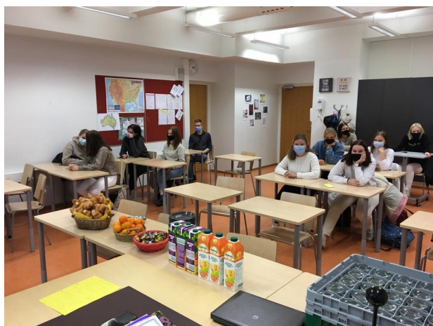
Lancement de l'atelier à Vaasa, Finlande

Pour rappel, cet atelier regroupe 17 élèves de 1ère de la spécialité SVT qui travaillent en collaboration avec les 17 élèves Finlandais sur les défis mondiaux et réels du changement climatique, leurs influences sur les territoires régionaux Européens scandinaves et méditerranéens et à l'adaptation et l'aménagement durable de ceux-ci au niveau local. La communication se passe entièrement en anglais !